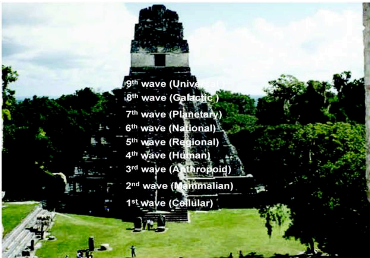
Fig 1: Kozmička piramida ili deveto-stepenasti bog (Bolon Yookte), čiji će se valovi ostvariti kada dođe do završetka Majanskog kalendara.

Uprkos svim tim smjenama u kozmičkoj historiji ja osjećam da je ova smjena nove svijesti specifična i važna i očekujem da će biti generisana devetim valom. Za početak, sve što znamo je da je dizajnirana da dovede smjenu jedinstva svijesti u kojoj će ljudski mozak prestati više da bude pod kontrolom tamnog filtera (pogledati Fig 2). Mi ćemo, drugim riječima, postati "transparentni" i ja vjerujem da je ovo posebna svijest – vidimo realnost kakva jeste bez razdvajanja – koju većina čeka. Ne samo bilo koja svijest, nego ona koja transcendirira između prošlosti i pomaže ljudima da vide ujedinjenje svih stvari. Razlog zašto takva vrsta vala jedinstva može biti od koristi planeti i čovječanstvu, je taj što vodi ka transcendiranju svih razdvajanja (između muškarca i žene, čovjeka i prirode, vladara i vladajućih, istoka i zapada, itd.). Ja osjećam da bez ostvarenja takvog tipa smjene svijesti svijet će prije ili kasnije doći do kraja. Ljudi sa dualnom i razdvajajućom sviješću su nešto slično kao ćelije raka u tijelu Zemlje, one se ne brinu za nešto veće i time dovode do kolapsa ekosistema. Samo smjena jedinstva svijesti će zauvijek zaustaviti ne provjerenu eksploataciju Zemlje i na dubljem nivou će nam omogućiti da shvatimo da smo mi dio kreacije i da moramo da živimo u harmoniji sa njom. Ali hoće li se takva smjena desiti automatski ?